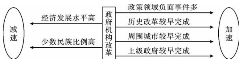
图1 政府机构改革推进影响因素示意图

本文的研究结果发现，较低的经济水平、较多的特定政策领域的负面事件、较低的少数民族人口比重、较早的上一轮改革完成时间、周围城市较早的完成和省级改革的较早完成有助于加快改革进度，从而有助于推动地方政府对于实现中央关于推行政府机构改革的时间依从度。这六个因素中的经济发展水平、负面事件、少数民族人口比例属于制度需求推动假设范畴，而其他三个因素都属于制度供给的因素，由此我们可以得出一个大致的模型，即地方政府在实现中央政府机构改革方案的进展和速度方面：一方面会从自身历史负面事件所可能引发的声誉维护的需求考虑加快推进，但同时也受到经济发展水平和当地少数民族人口比例的制约；另一方面更多的是因为省级改革和周围城市改革的双重压力以及上一轮改革的自身惯性而加以快速推进。从具体的回归结果来看，地级市政府推进机构改革更重要的是来自上级政府和周边地区的压力和示范，其显著性水平更高，自身的需求偏好虽然也在其中，但只是其中的因素之一，因此中央权威对于在政策执行中的正面效果明显比地方政府自身的偏好因素影响更大，这也从另一个层面间接证明了我们前文的观点。